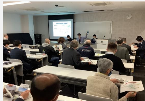
〈民間事業者への説明会〉