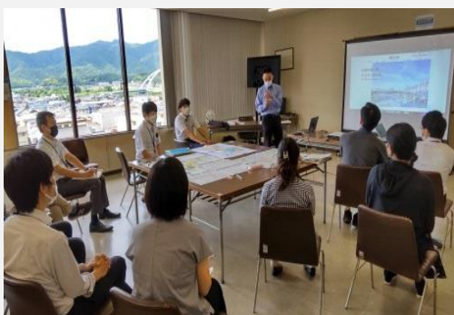
〈民間提案制度専門部会〉

他にも、民間提案制度において、本市が今後募集していく施設や取組内容について、民間事業者向けの説明会を実施し、新規事業や事業拡大の際の公共施設の活用を提案しました。