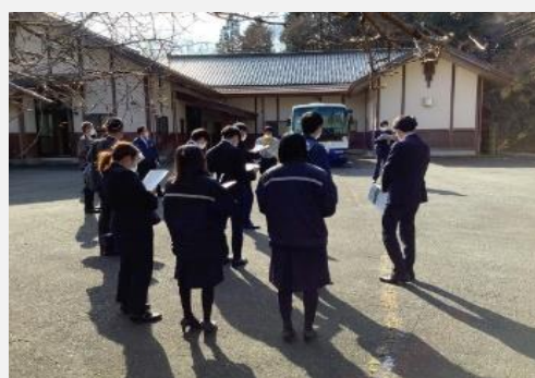
〈未利用公有財産マッチングツアー〉