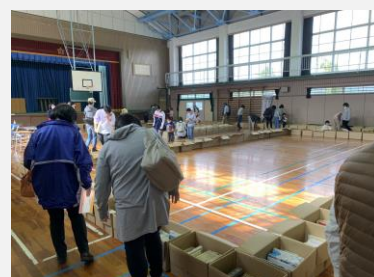
〈廃校備品販売会・廃校図書譲渡会〉