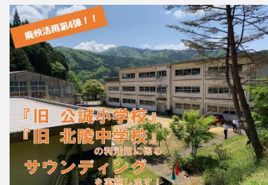
〈サウンディング型市場調査〉