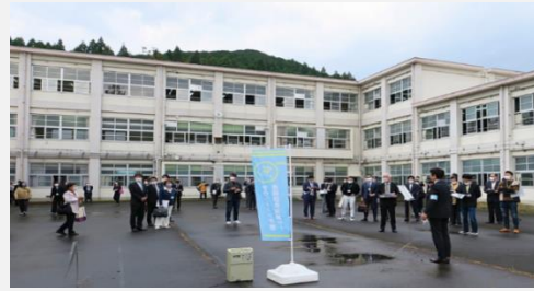
〈旧明正小学校の中庭でのオリエンテーション〉