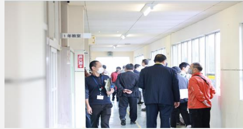
〈旧上六人部小学校でのツアー中の様子〉