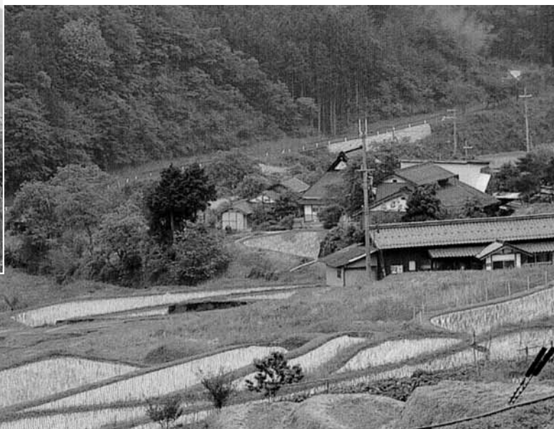
守り続けたい、ふる里の自然 日本の棚田百選（大江町毛原）