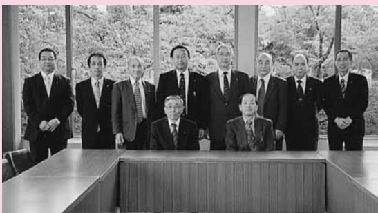
議会だより編集委員会メンバー

萌葱色の山々から新緑が鮮やかに水田に映し出される季節になりました。「議会だより編集委員会」の委員も5月臨時市議会より交代しました。文字も大きくし、皆さま方と議会が身近で親しみのある編集に今年一年間努めてまいりますのでよろしくお願いをいたします。