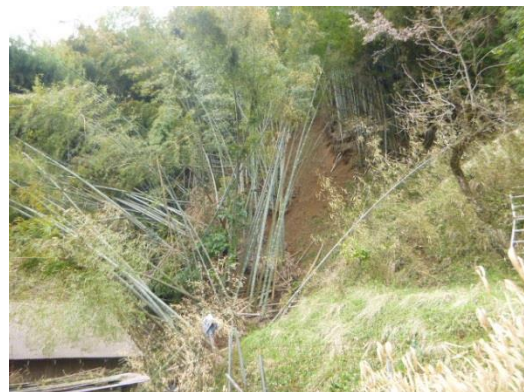
山腹被災状況（大江町河守地内）