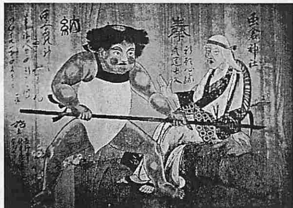
絵馬：山姥と金太郎