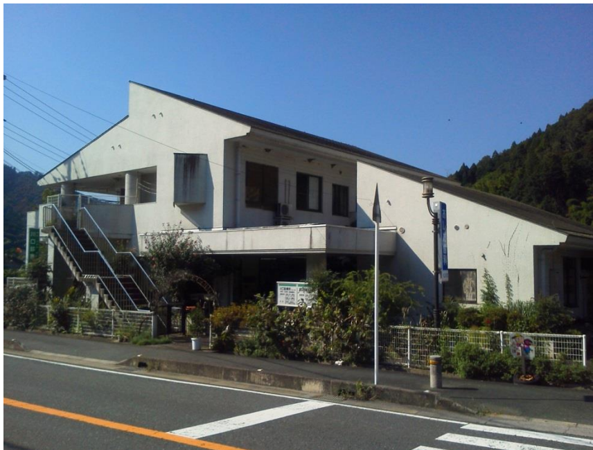
川口診療所・あしだ歯科診療所（下小田）