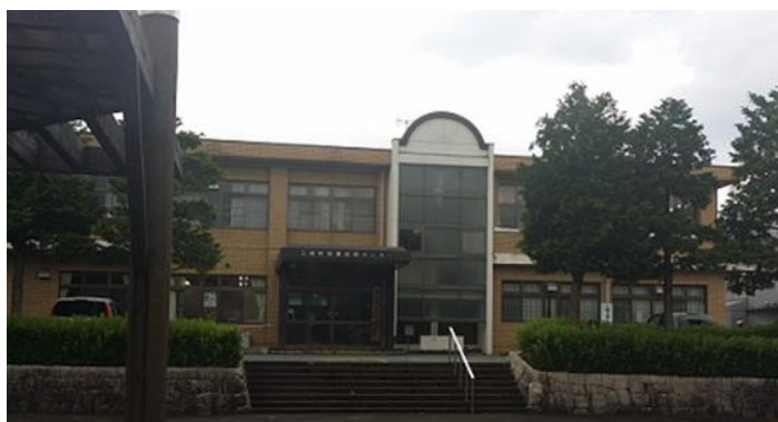
三和町農業振興センター

(款)府支出金 (項)府補助金 (目)総務費府補助金 地域創造拠点整備支援交付金 3,000千円