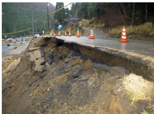
地滑り状況 (二瀬川大江山線)