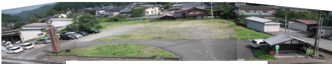
土地利用を進める 旧夜久野町役場跡地全体図

(款)市債 (項)市債 (目)総務債 夜久野町賑わい創出事業 (過疎対策債) 15,300千円