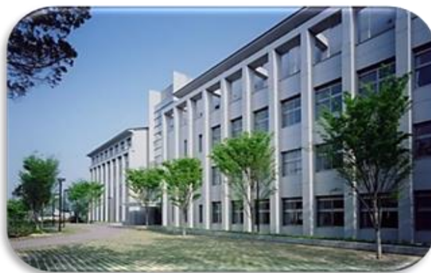
平成28年4月開学「福知山公立大学」

大学の開学を市内外に広くPRするため、著名な研究者等による講演会やシンポジウムなどを開催