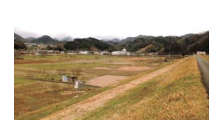
弘法川調節池 (予定地)