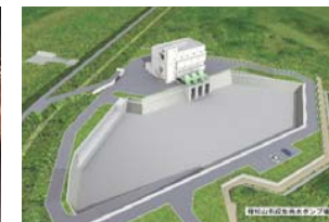
段畑ポンプ場 (完成イメージ)