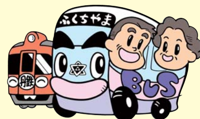
イラスト提供/おまつかつみさん