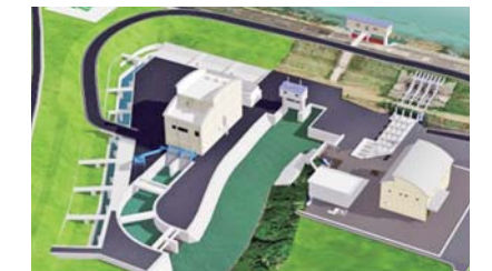
弘法川排水機場 (完成イメージ)