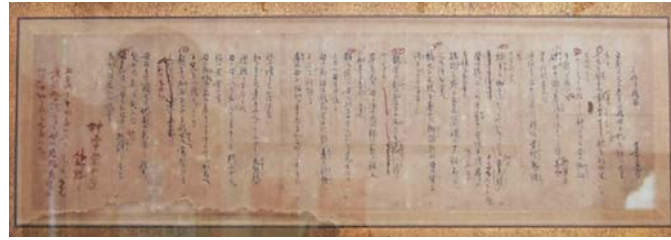
真下飛泉 歌稿 「うれし我母」

末尾には、「お羨しき身の上と存じ候、小生慟哭天に訴ふるも今や慈眼慈掌の双親は返り来らぬ身に候」と鉄幹の感慨が綴られています。真下飛泉資料室は、京都丹後鉄道「大江駅」の2階にあります。無料でご覧いただけますので、電車の待ち時間などにぜひご覧ください。