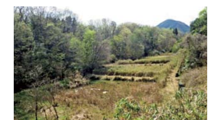
西川調節池 (予定地)