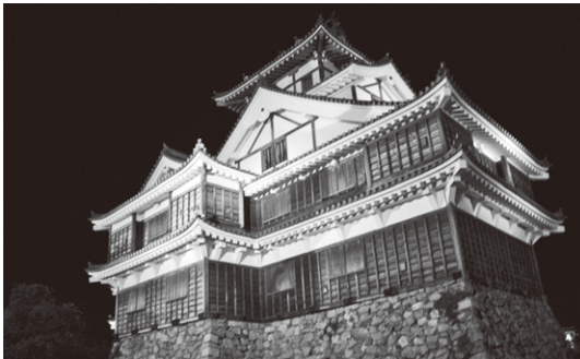
▲福知山城をピンクにライトアップします。