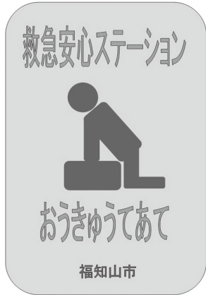
① 応急手当ステーション