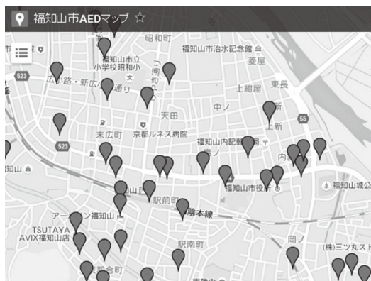
③ AED マップ

安心ステーションとは、AEDが設置されている事業所や応急手当講習を受講した人がいる事業所などを対象に「救急まちかど安心ステーション」として認定し標章を交付するものです。