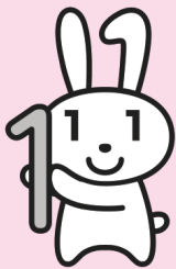
「マイナちゃん」 (マイナンバー制度の 広報用ロゴマーク)

マイナンバー制度のお問い合わせは 0570-20-0178 (全国共通ナビダイヤル) ※おかけ間違いのないよう、くれぐれもご注意ください。 平日午前9時30分〜午後5時30分(土日祝日・年末年始を除く)