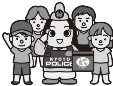
京都府警察シンボルマスコット「ポリスマヤこ」