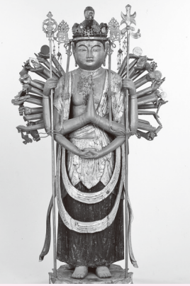
千手観音菩薩立像