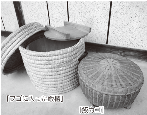
「フゴに入った飯櫃」

ところで、飯カゴにこびりついた米粒、おやつになったのをご存じでしょうか。母は、杓子 しやくし でこそげとった米粒を洗って乾かしフライパンで煎り、砂糖醤油で味付けしました。アラレのようなポリポリした香ばしい食感が懐かしいです。