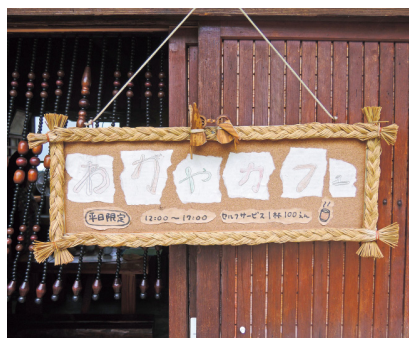
▲地域の人たちによる手作りの看板