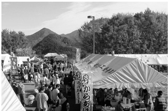
『過去の夜久野農林商工祭の様子』