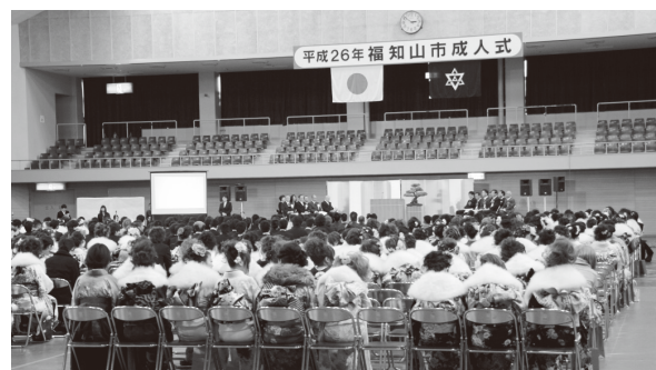
『昨年の成人式の様子』