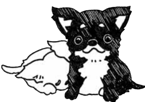
イラスト提供 / にしやまみほさん