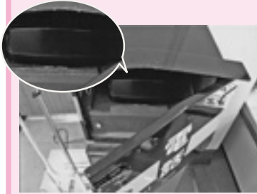
私のイチオシ 真っ黒でダイヤルがない緊急電話

『今日予定があいてるな』『どこかへ行きたいな』と思ったら『ポッポランド』を検討してみてください。