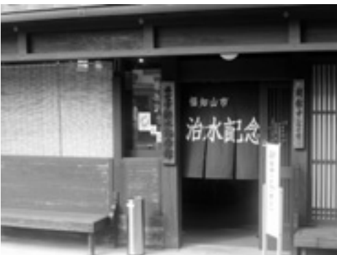
藍のれんの設置例(治水記念館)

※事業要綱や申請書は、市のホームページからダウンロードできるほか、まちづくり推進課にあります。