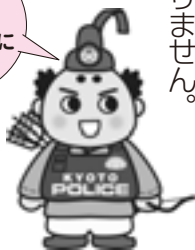
京都府警察のシンボル マスコット「ポリスマロン」

が り ま せ ん。 #9110は、ダイヤル式・ IP電話の一部機種ではつな が り ま せ ん。 0または#9110) #9110は、ダイヤル式・ IP電話の一部機種ではつな が り ま せ ん。 ○京都府警察本部総合相談室 (TEL075・414・011 0または#9110) ○福知山警察署 (TEL22・01 10)