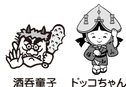
酒吞童子 ドッコちゃん