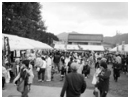
昨年の様子 各種模擬店

とき・ところ 11月11日(日)午前10時～午後3時 道の駅「農匠の郷やくの」(夜久野町平野)