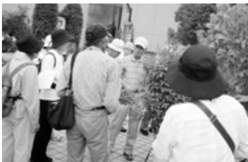
前回の観察会の様子