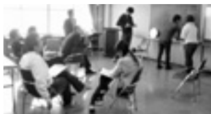
昨年のセミナーの様子

申込方法 11月5日(月)までに名前、住所、電話番号を人権推進室男女共同参画推進係(TEL 24・7022・FAX 23・6537)まで連絡してください。