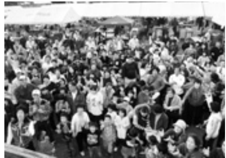
昨年の様子 来福 餅まき

夜久野農林商工祭実行委員会事務局 (夜久野支所地域振興係内 TEL37-1103・FAX37-5002)