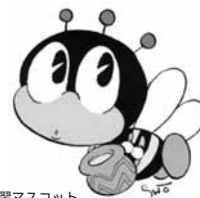
生涯学習マスコット 「マナビイ」デザイン:石森 肇太郎

生涯学習への意欲と人権尊重の意識を高めるために、「生涯学習フェスティバル2010 in ふくちやま」を開催します。入場は無料です。ご来場をお待ちしております。