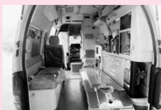
10月14日(木)の寄贈式(消防署にて)