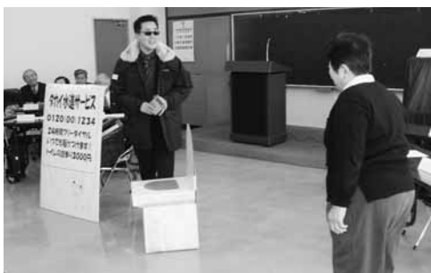
消費生活出張講座では、寸劇などで、悪質な手口や予防方法を紹介しています。

勧誘する業者とは別の業者が、金融庁や証券取引等監視委員会、消費生活センターなどの名前を騙つて電話をしてくるものです。消費者が、勧誘されている未公開株の相談をすると、その企業は「大丈夫」と言つて消費者を安心させる手口です。この場合も事例のように、D社と公的機関を名乗る業者が共謀している可能性ががあります。