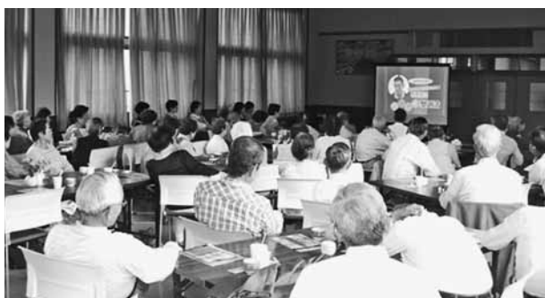
市内各地での消費生活出張講座のようす

くらし・健康・はばたきフェスタ2010「毎日を楽しく生きるために」知る・考える・選ぶ・行動する」をテーマに、くらしに関するさまざまな情報と市民交流の場を提供します。ときノ11月28日（日）午前10時ノところノ厚生会館（西中ノ町）内容ノ手づくり体験・健康・食・環境などの各コーナー、その他ステージ発表など 生活交通課 24 7020