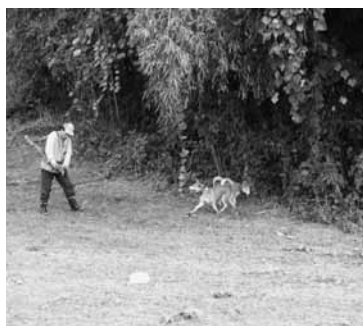
犬によるクマの捜索

近くに必ず親グマがいます。近づいたりすると子グマを守るため襲ってくる場合があります。すぐにその場から立ち去りましょう。