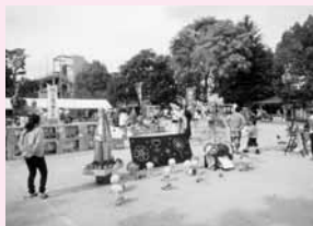
アイデアあふれるユニークな作品が並ぶ御霊公園会場

ものをつくる「手」と、創造する「頭」、仲間と共につくる「輪」から命名した「シロテテナガザル(テトワちゃん)」