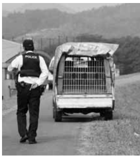
クマ捜索の様子(10月20日(水)和久市町、由良川河川敷にて)

秋はクマの出没が多くなる季節で、地域の行事も多いことから、市民の皆さんは事故に遭わないよう充分に注意してください。