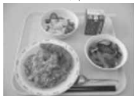
給食でも地元野菜を使ってCO 2 削減