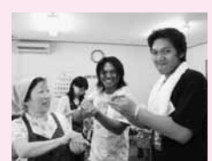
これまでの国際交流活動のようす

時間/午後1時~午後3時(予定) 内容/市民・外国籍市民から日本・福知山・ 外国での経験や感動したこと、感じたことなど を発表していただきます。 参加者にとって新たな視点 を与えてくれる良い機会に なると思います。発表会終 了後、交流会も予定してい ますので、ふるってご参加 ください。 参加費/無料、事前申し込み不要 問い合わせ先/福知山市国際交流ネットワ ーク会議事務局(まちづくり推進課内 24 7033・ FAX 23 6537)