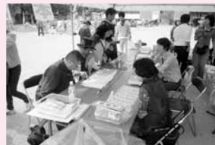
実行委員・審査員長による作品選考の様子