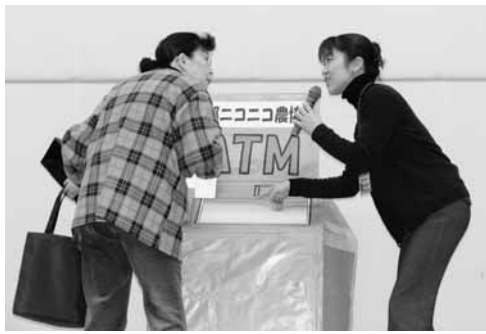
市内研修会での振り込め詐欺予防啓発のようす