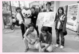
各高校からの有志でPR隊も結成!広小路通りや三段池公園などでイベント広報をしました

「広報ふくちやま」は、資源保護のため再生紙と、環境にやさしい大豆油インキを使用しています。