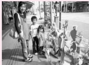
広小路通りの歩道でも展示し、来場者を楽しませました