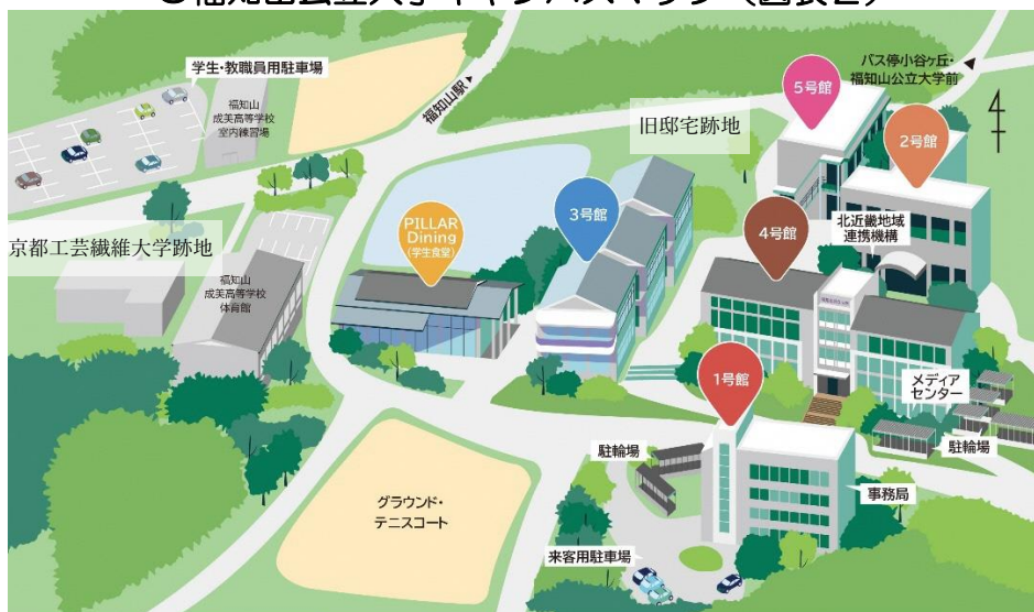
○福知山公立大学キャンパスマップ（図表2）