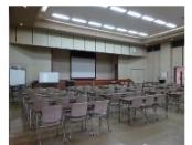
老朽化した内装・設備