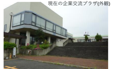
現在の企業交流プラザ(外観)