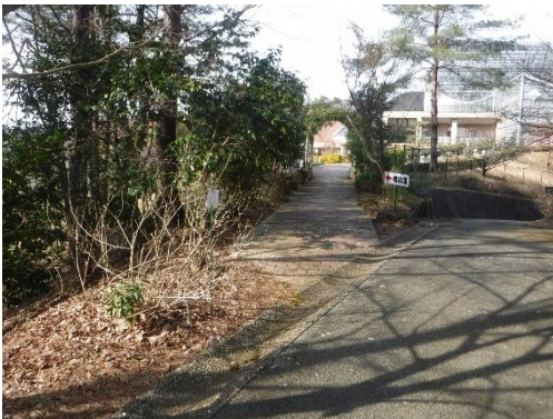
3 (周遊道 植物園南側)