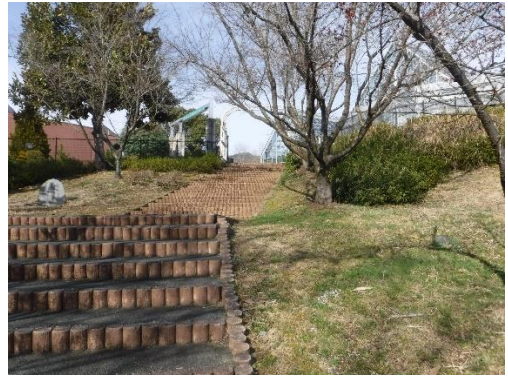
4 (周遊道 植物園南西側)