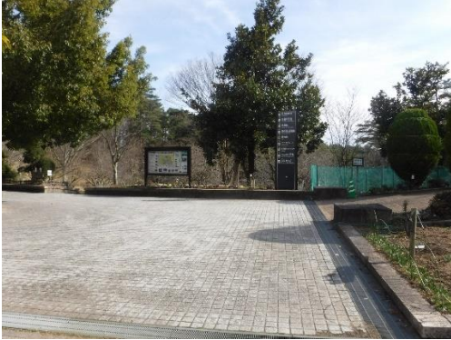
1 (周遊道 案内板周辺)