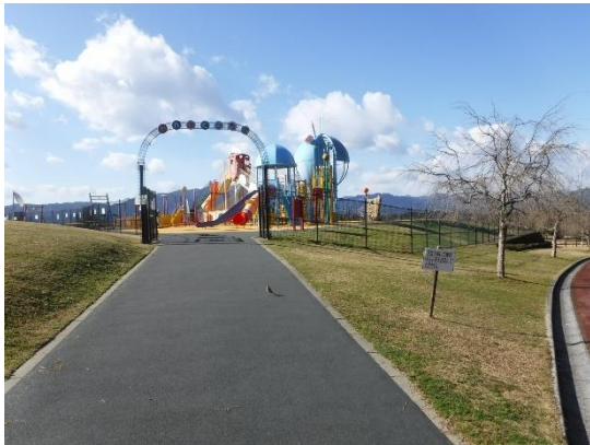
イー1 (わんぱく広場入口)