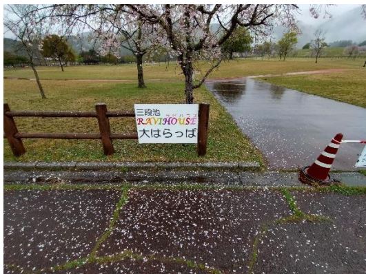
ア-3 (大はらっぱ南側)