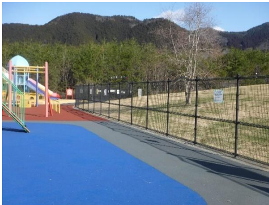
イー4 (わんぱく広場外縁内側)