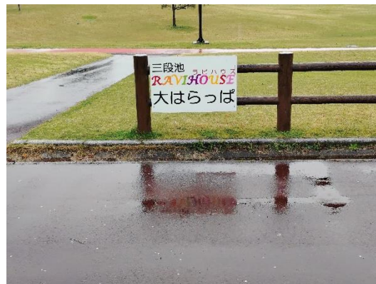
ア-4 (大はらっぱ東側)