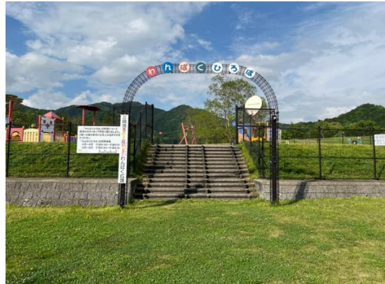
イー2 (わんぱく広場入口)