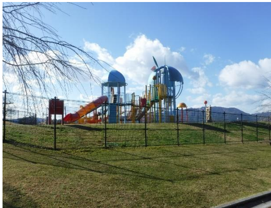
イー3 (わんぱく広場外縁外側)