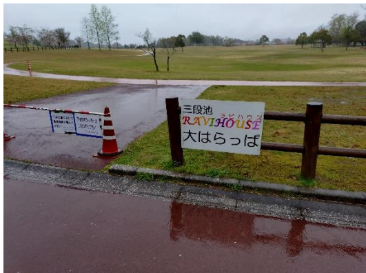
ア-1 (大はらっぱ北側)