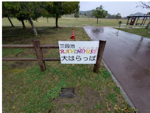
ア-2 (大はらっぱ西側)