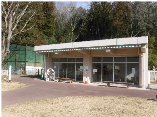
2 (レッサーパンダ舎)