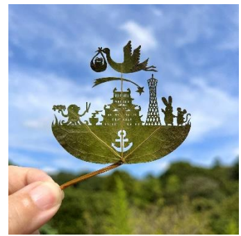
葉っぱの小旅行 in 兵庫