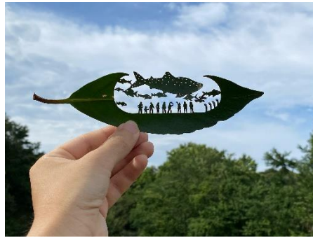
葉っぱのアクアリウム ※転機になった作品