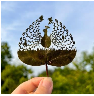
たまにはのんびり、 葉根も伸ばさなくちゃね