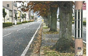
【けやき通り落ち葉処理】

⑤誰でも移動手段が確保できる仕組みづくり。 ※福祉・交通空白地有償運送を軸とし、無償の移送サービスの導入も検討中