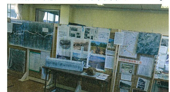
旧川合小に開設した「ちっちゃな平和ミュージアム」