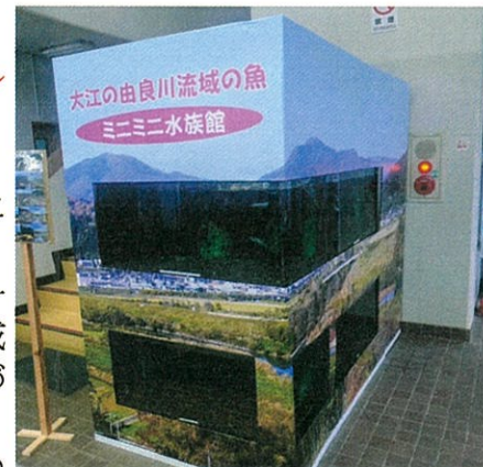
大江駅に設置された「ミニミニ水族館」

市民生活部長 あしぎぬ大雲の里のさらなる活性化に向けて、地域の賑わいづくりを図っていきたい。