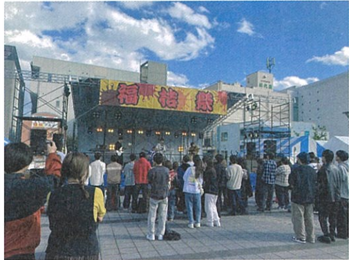
福知山駅北広場で開催された 公立大学園祭

12月定例会は12月1日から12月23日まで開催され、30議案が提出されました。日本共産党市議員団は、物価高騰対策、市民福祉の増進と生命を守る立場で議案質疑や一般質問等を行いました。