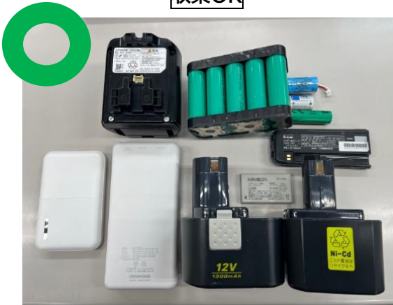
リチウムイオン電池、ニカド電池、ニッケル水素電池、モバイルバッテリー