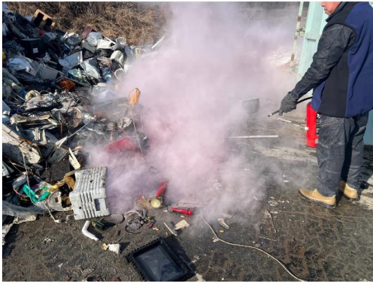
福知山市環境パーク内発火時の消火活動の様子