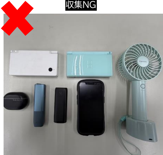
電子タバコ、ワイヤレスイヤホン、ハンディファン、電気シェーバー、おもちゃなどの小型家電

(理由:福知山市では、左図のようなリチウムイオン電池を内蔵する小型家電は、小型家電リサイクル法に基づく分別収集を行い、適正にリサイクルを促進しています。このため、リチウムイオン電池の処理スキームとは異なることから、対象品目にしていません。)