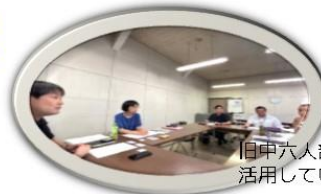
←中丹FM関連部局会議の様子