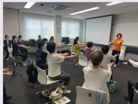
貯筋体操指導者育成講座の様子