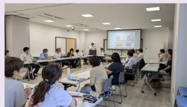
権利擁護ネットワーク会議の様子