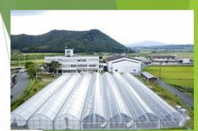
旧中六人部小学校を活用しているTHE610BASE→