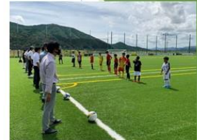
↑旧天津小学校を活用しているS-LAB