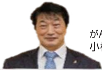
がん検診アンバサダー 小橋建太さん