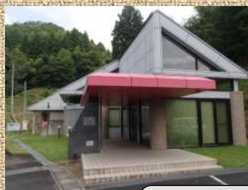
サテライトオフィスアトリエ