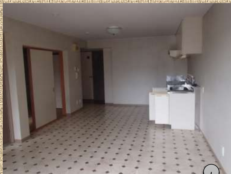
宿泊棟 (写真はB棟のものです)