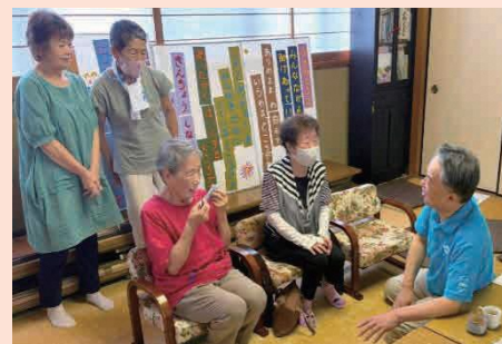
識字学級 (市長と談笑)