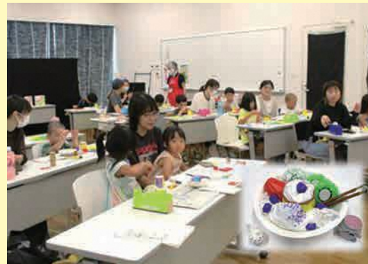
わくわくチャレンジ (プリンアラモードをつくろう)