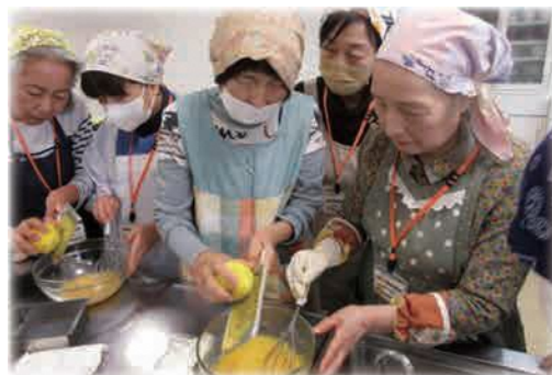
中央公民館講座「柚子ジャム作り」