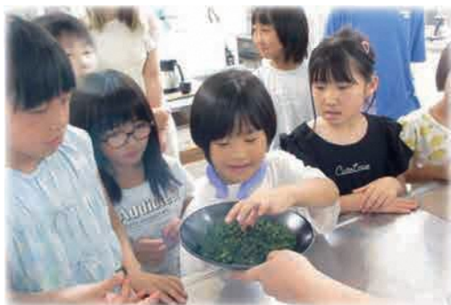
わくわく体験教室「地元のお茶を知ろう～抹茶」