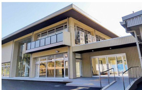
リニューアルオープンした川口地域公民館(上)と体育館(下)

新しい公民館では誰もが利用しやすいようにエレベーターやバリアフリートイレを整備。さまざまな生涯学習講座を開催します。また太陽光パネルと蓄電池を備えており停電時に電力を確保できる避難所としても活用できます。