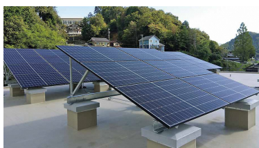
太陽光発電システム。42枚の太陽光パネルで自家発電