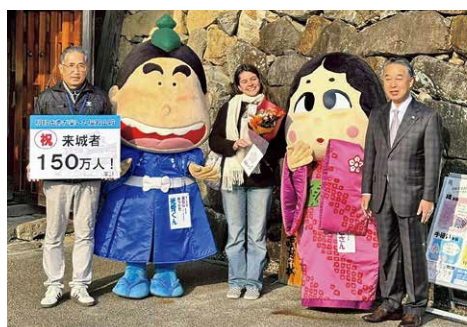
来城者150万人を記念したセレモニーの様子