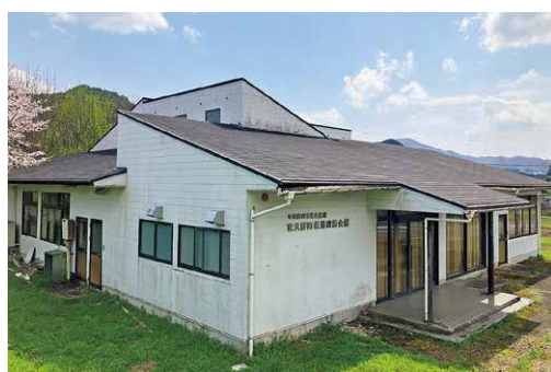
旧夜久野町構造改善会館

移住者や地域住民の交流の 場としてのコミュニティス ペーの運営のほか、夜久野の 地域資源の活用や地域団体と 連携して夜久野の魅力を発信 し、「夜久野ファン」を増や すことをめざします。26年度 中の開業を見込んでいます。