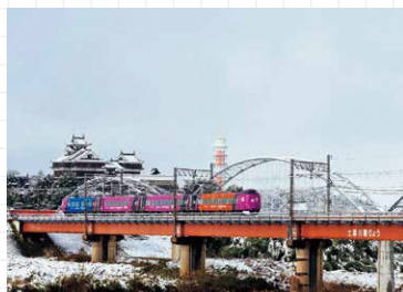
oris640 #サングイトレイン