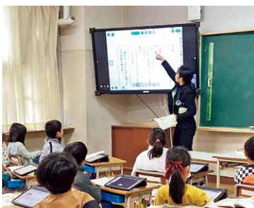
電子黒板とタブレット端末を活用した小学校の授業

扶桑化学工業株式会社から ICT教育費に企業版ふるさと納税 長田野工業団地に拠点を置く扶桑化学工業株式会社から、企業版ふるさと納税として2千万円の寄附がありました。タブレット端末の付属品や電子黒板などICT教育に活用します。扶桑化学工業からの寄附は6回目で総額は1億1千万円になりました。これまでスクールバスや救急車の購入費などに活用しています。 ☎ 教育総務課 (TEL 24-7061)