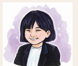
ヤングケアラーコーディネーター (保健師)