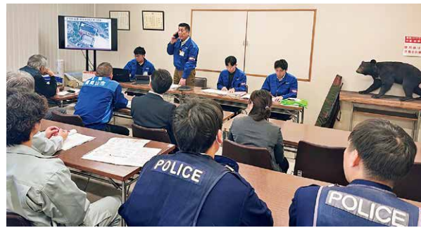
多機関が参加した机上訓練。別室にいる市長と職員が状況をやりとりし、クマのはく製に対して発砲を発声しました。