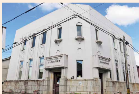
旧福知山信用金庫本店 外観

また、出入口の木製ガラス扉から中に入ると、4段の花崗岩の階段があり、壁面の腰部分には緑色のモザイクタイルが貼られています。内部は改修されていますが、天井を貼らず、高さ4・3mある広々とした空間はかつての銀行の営業室を偲ばせます。