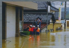
第2回「要配慮者の避難」2023/1/22