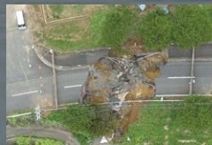
第3回「台風第7号の教訓」2024/1/21