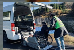
第4回「要支援者の避難」2025/1/26