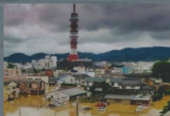
第1回「避難のあり方」2022/1/23

これまで開催した本シンポジウムを 総括し、市民の皆さんに広く情報発 信を行い、誰一人取り残さない防災 の実現をめざして開催します。