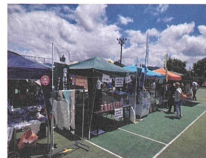
(6月29日に開催された「夜久野 みどり香るマルシェ」会場)