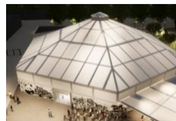
関西パビリオン会場イメージ図

(款) 繰入金 (項) 基金繰入金 (目) 基金繰入金 ふるさと納税基金繰入金 565 千円(令和6年度分)