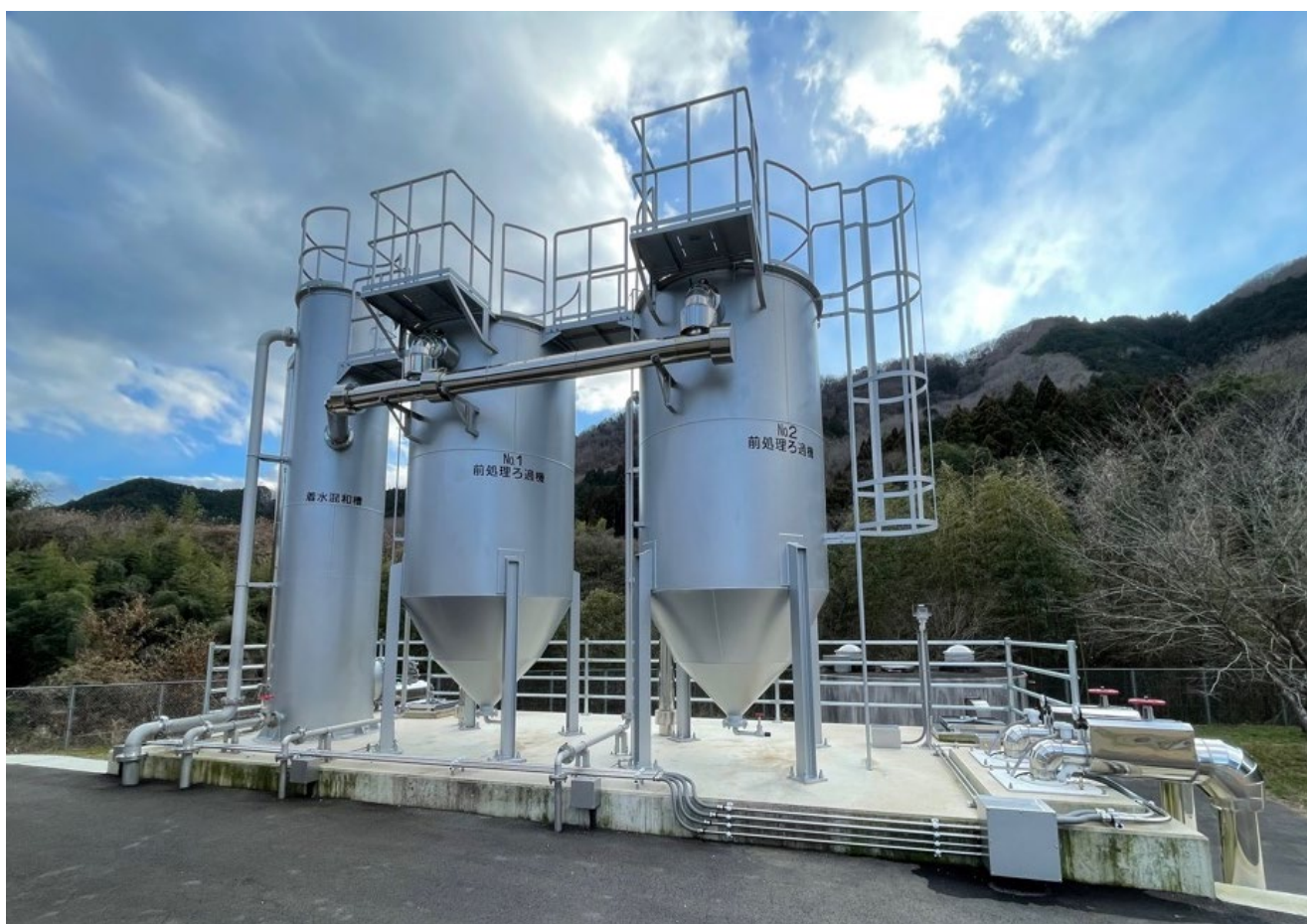
芦洲第2取水場前処理設備