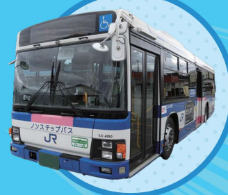
現運行会社 西日本ジェイアールバス [園福線]