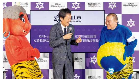
2月1日(木)に行われたイベントで、兄・千原せいじさん(写真右)のサプライズ登場に驚く千原ジュニアさん(写真中央)と酒呑童子(写真左)。