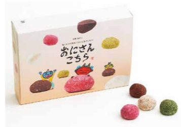
「鬼とヒトが仲良くなれる」をコンセプトに開発した新商品「おにさんこちら」は、大江作業所公式オンラインサイトのほか、福知山鉄道館アフレルなどでも購入できる。

その一環として、2月1日(木)、東京都赤坂で、鬼に親しむ文化が根付く本市ならではの「豆を投げずに分け合う」新たな節分のあり方を提言する報道機関向けイベントを開催。テレビなど20社以上が出席しました。