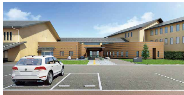
4月1日(月)にリニューアルオープンする三和荘の完成イメージ図

宿泊施設は備品や内装を一新し、7室すべての客室に浴室を設けました。レストランは、(株)ファーストシステムに