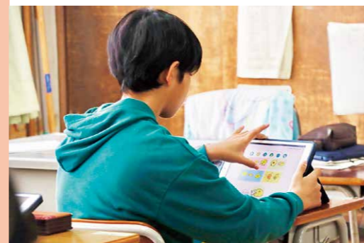
児童らは、登校後それぞれのタブレット端末からその日の心の状況を入力。

「子どもたちの表情や声の調子を教室で確認する日々の健康観察は変わらず大切にしています。ただ、直接言えない思いを持っている子どもたちの「心の声」を集めるツールとして、とても効果を感じています。過去の事例として、喧嘩をして指導した子へ、後日『どうや？』と声をかけると『大丈夫』とは言うものの何か様子がおかしい。すくすくを見ると、指導をした日から『モヤモヤ』が続いていることが分かり、次のアプローチが必要だと気づけたことがありました。高学年になるにつれ、周囲に気を遣ったり、直接気持ちを伝えるにできなかったりする児童が出てくるので、担任はもちろん、養護教諭など全教職員が一緒になって、子どもたちの細かな心の動きに気付けるよう心がけています」