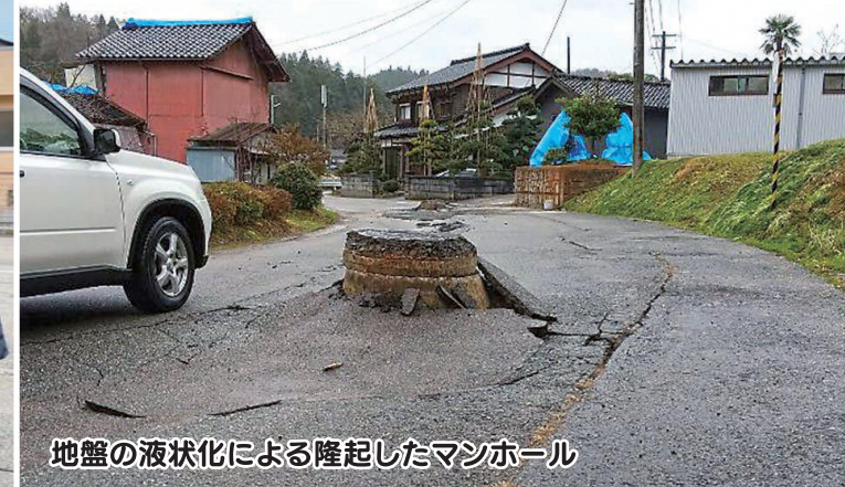
地盤の液状化による隆起したマンホール