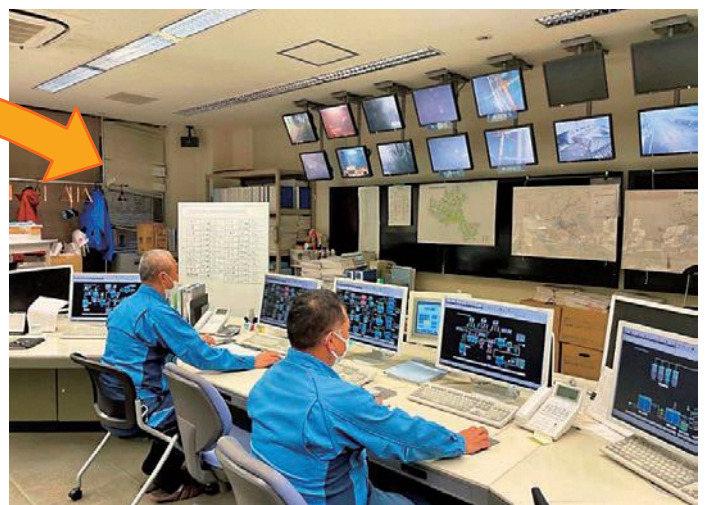
水質測定所（夜久野町下町地内）

色度・濁度・遊離残留塩素を自動測定し、上下水道部庁舎にデータ送信し、確認しています。