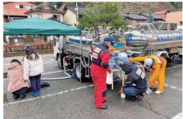
他市と協力し給水支援