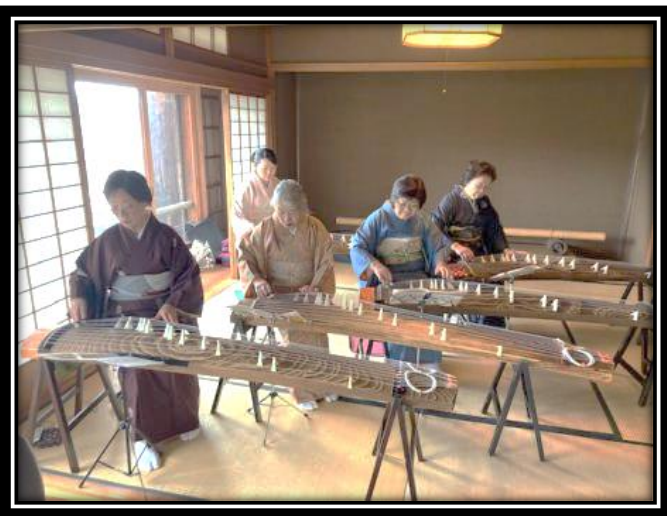
琴の調べを奏でる様子

令和6年3月20日(水・祝)に開催の大雲一豊市に向け、2月15日(木)まで出店者の募集をしていたが昨年を超える多くの応募があったそうだ。これまで、プレイベントも3回開催され、総勢100名を超える参加者があり、期待も高まるばかりである。大江支所職員は「昨年度の大雲一豊市では400人を超える来館者があり、大いに賑わった。今年度は昨年を超える来館者を期待している」と語っている。