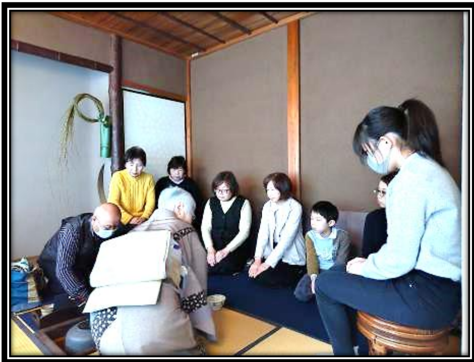
来館者がお茶会を楽しむ様子

令和6年2月17日(土)の午前10時から午後3時まで、福知山市大雲記念館で、初釜茶会が行われた。令和5年12月23日(土)に引き続き、2回目のお茶会の開催であったが、お昼過ぎには定員を超える大盛況だったそうだ。