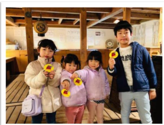
記念品を喜ぶ子ども達

クイズラリーの正解者には記念品がプレゼントされた。なんと大江支所職員の手作りだという。今後も自作した記念品を用意する予定だそう。