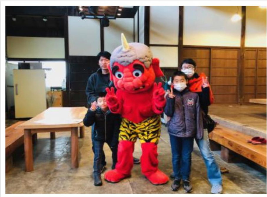
家族連れが鬼と記念撮影をする様子

参加者からは「大江町に住んでいるがわからない問題が多い。勉強になって来ましたが、とても素敵な建物ですね」という声をいただきました。このイベントをきっかけに大雲記念館の来館者が増えることに期待したい。