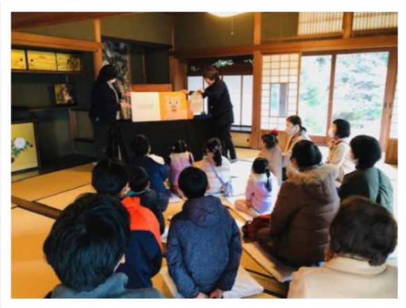
おはなし会を楽しむ様子

おはなし会は2部構成で開催され、多くの来館者が参加し、楽しんだ。中には2回とも参加した来館者もあり、紙芝居や絵本に夢中だった。