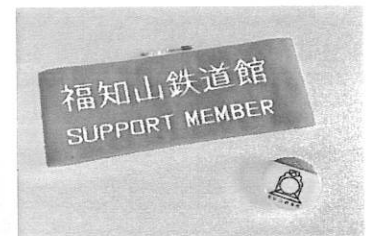
フクレル特別会員証 (腕章タイプ、バッジタイプ)