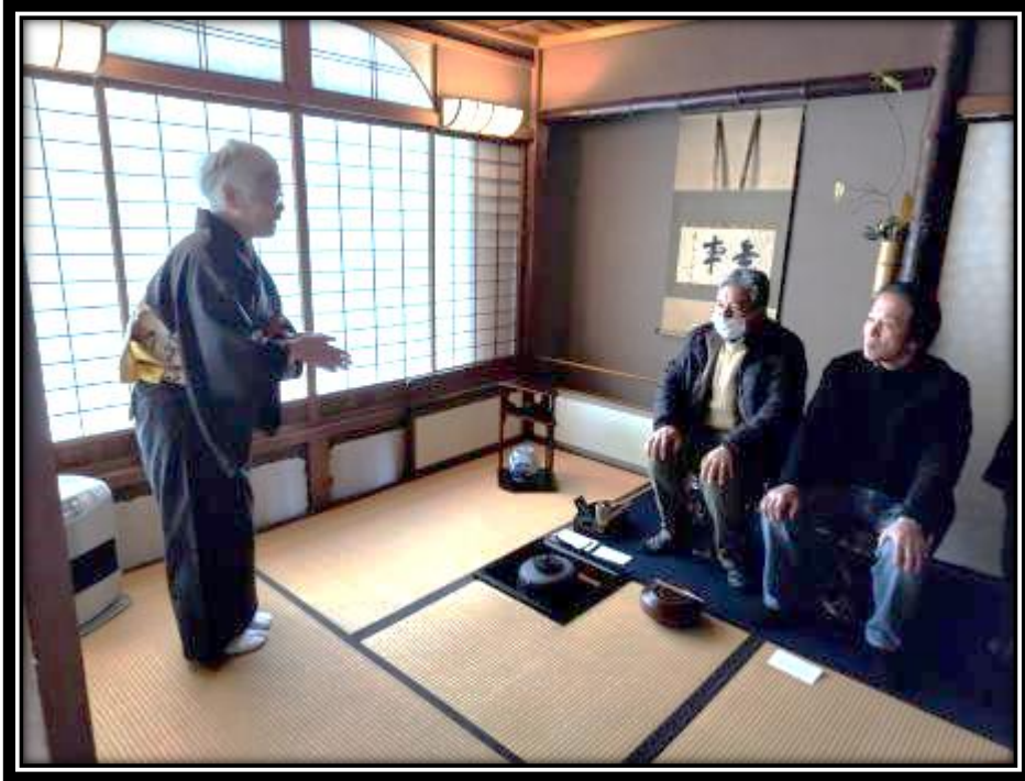
来館者がお茶会を楽しむ様子

令和5年12月23日(土)の午前10時から午後3時まで、福知山市大雲記念館で、お茶会が行われた。大雲記念館には、壁面まで意匠を凝らした茶室がしつらえられており、先生の指導の下、来館者はお茶や