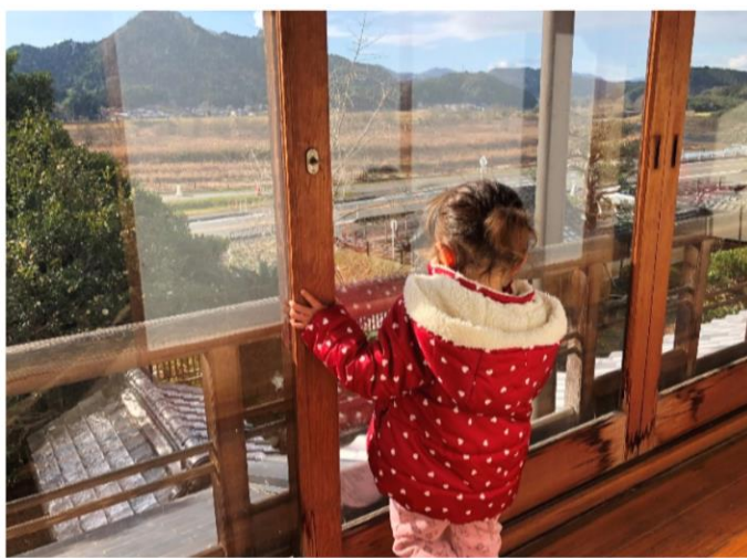
景色を楽しむこどもの様子

令和6年3月20日(水 祝)に開催予定の大雲一畳市に向け、市は1月にも大雲記念館を利用してイベントを開催予定だそう。今回のプレ企画の際にも小さい子どもを連れた親子連れも来館しており、子どもが大雲記念館の広い空間を歩いて楽しんで、景色を見たりする姿が見られた。