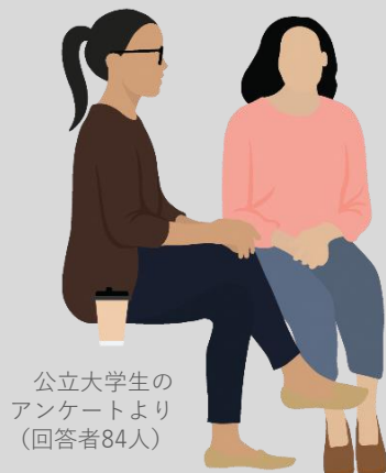
公立大学生のアンケートより (回答者84人)