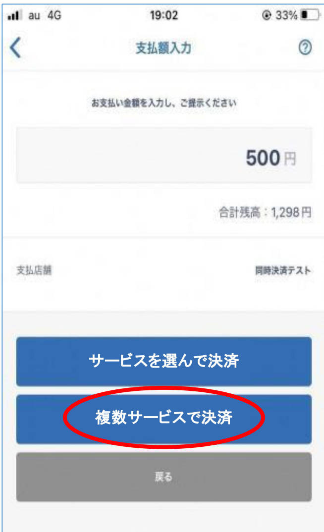
金額入力画面が上のようになります

複数のサービスの残高を同時に決済に使用できるようになります (11/13までに実装予定)