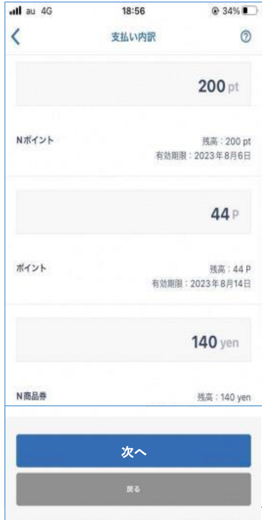
複数サービスで決済を選択すると有効期限の近いサービスを優先し自動で振り分けられます