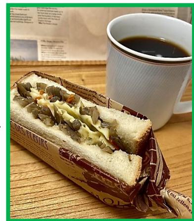
きんぴらごぼう+とろけるチーズ