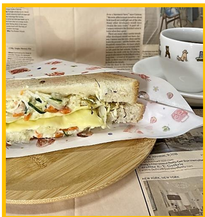
ポテトサラダ+カットキャベツ+とろけるチーズ