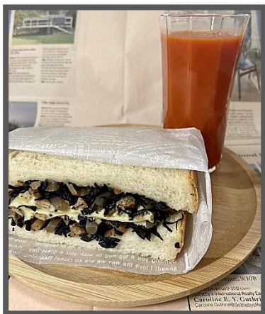
ひじきの煮物+とろけるチーズ