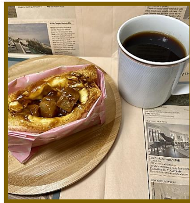
カレー+カットキャベツ+とろけるチーズ