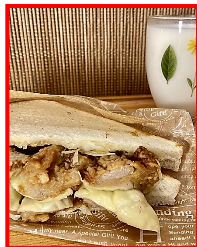
唐揚げ+カットキャベツ+とろけるチーズ