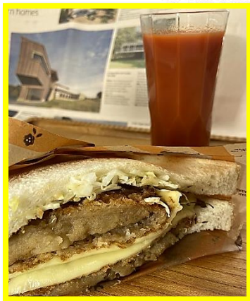
コロッケ+カットキャベツ+とろけるチーズ