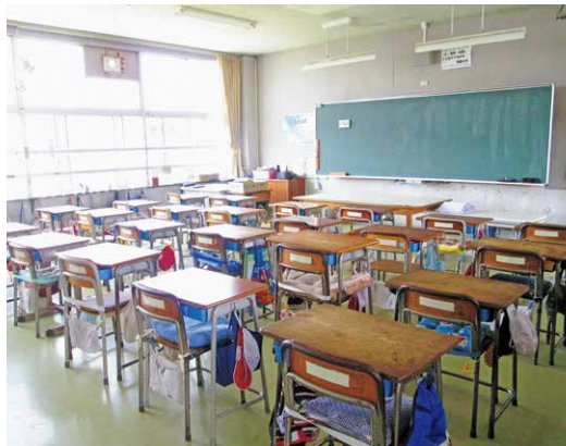
子どもたちが安心して学ぶことのできる教育環境を