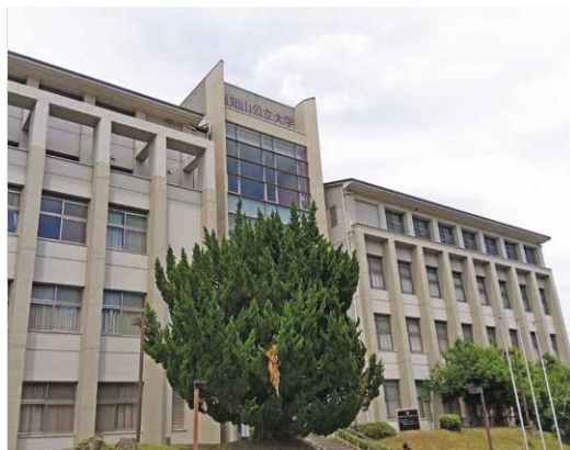
市内出身者のさらなる入学者増が望まれる 福知山公立大学