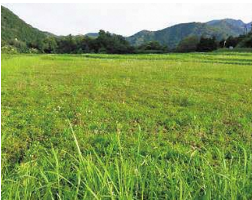
作付けが望まれる休耕地