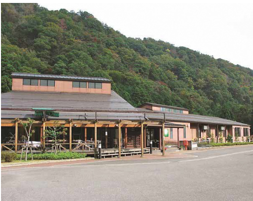
酒呑童子の里（大江町）