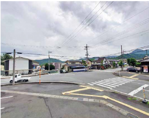
信号機設置を要望する旭が丘地内交差点