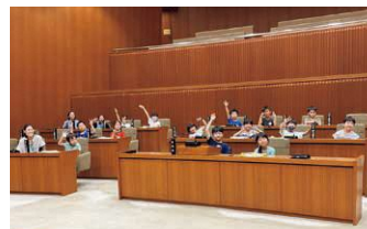
上川口小学校3年生