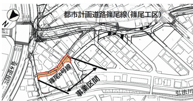
市道篠尾6号線事業区間

問 市道篠尾6号線の道路詳細設計業務と用地測量業務の委託料1000万円の内訳は。 答 道路詳細設計業務に800万円、用地測量に200万円を計画している。