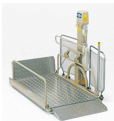
給付品目に加えられた「車いす用段差昇降機」(イメージ)