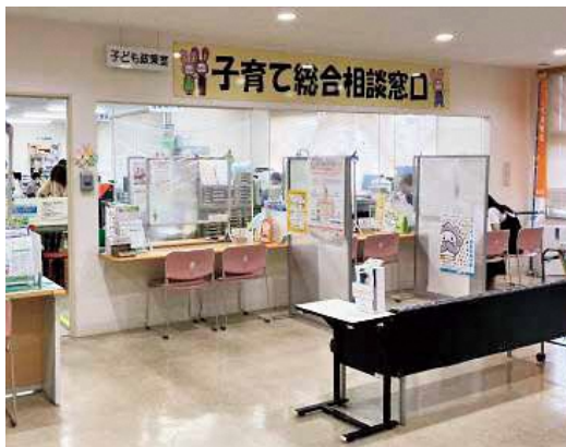
親の妊娠期から子の自立期（18歳）まで切れ目のない支援を目指す子ども政策室