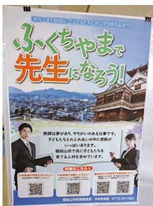
教員不足解消のために作成されたポスター