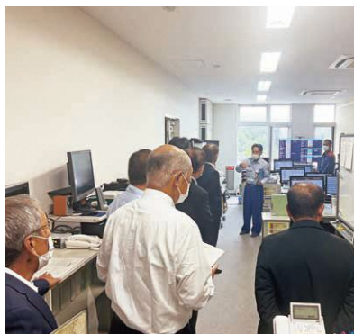
消防指令センター内を視察

令和6年4月から運用開始予定の標記消防指令センター共同運用に伴い、その中心となる消防指令センターが本市消防防災センターに設置される。準備状況の現地確認、視察を実施した。まず消防本部より、京都市中・北部6消防本部から職員の出動を受けた24名の人員で指令センターの運営を行うこと、センター長は本市から派遣し職員の負担軽減のために3部体制で勤務をすることなどの説明を受けた。 また、大規模災害時に、ある一つの消防本部管内からの119番通報が集中する場合は、災害が発生している消防本部へ指令前に事案を引き継ぎ、引き継がれた消防本部が出動指令を