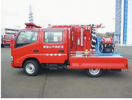
導入車両のイメージ