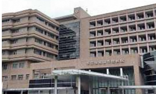
新型コロナ対策を担う福知山市民病院