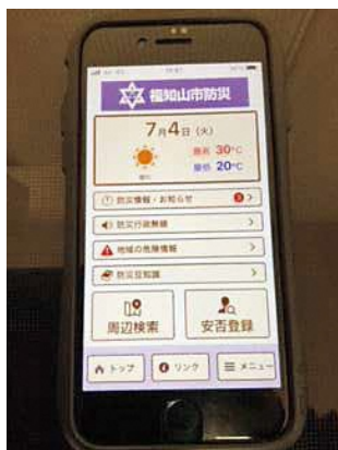
1万3千件がインストールされている福知山市防災アプリ

問 大江地域では、河守・公庄地域の排水ポンプ場の設置や公手川の改修が進んでいるが、右岸地域の内水対策はどうするのか。