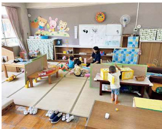
昭和幼稚園での2歳児預かり事業