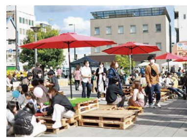
ファーマーズマーケットの様子

A 駅南は全国的なチェーン店を中心に発展をしていますが、駅北は取り残されたさびれた商店街でした。そこに再び賑わいを取り戻せるように、今までに銀鈴ビルも含め24店舗のお店を誘致させて頂きました。また、空きスペースを活用したファーマーズマーケットやサタデーズナイトといった催事を行うことで賑わいを創出してきました。