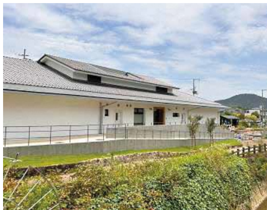
8月26日オープン予定の福知山鉄道館フクレル