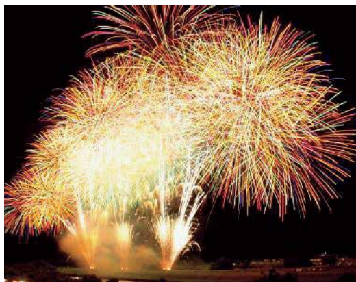
開催が途絶える前の花火大会