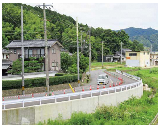
まもなく完成予定の私市地区の市道堺線