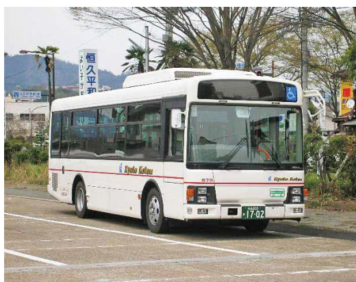
新たな運行事業者となる京都交通の路線バス