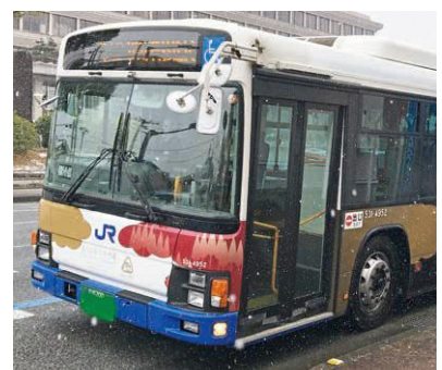
現在運行中のJRバス