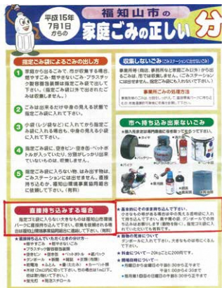
「指定ゴミ袋に入れていただいても有料」と記載されているパンフレット

問 指定ごみ袋の持ち込みは条例では無料だが、平成15年の「家庭ごみの出し方」のパンフレットには有料とあるが条例違反だ。 答 パンフレットとは、約20年前のもので、有料との記載理由は不明。実際の運用は過去から、指定ごみ袋の中のごみを計量し、処理手数料を徴収し指定ごみ袋は返却しており条例違反とは考えていない。