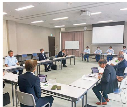
進捗状況の説明および質疑応答の様子

令和6年4月から運用開始予定の標記消防指令センター共同運用に伴い、その中心となる消防指令センターが本市消防防災センターに設置される。準備状況の現地確認、視察を実施した。まず消防本部より、京都市中・北部6消防本部から職員の出動を受けた24名の人員で指令センターの運営を行うこと、センター長は本市から派遣し職員の負担軽減のために3部体制で勤務をすることなどの説明を受けた。 また、大規模災害時に、ある一つの消防本部管内からの119番通報が集中する場合は、災害が発生している消防本部へ指令前に事案を引き継ぎ、引き継がれた消防本部が出動指令を