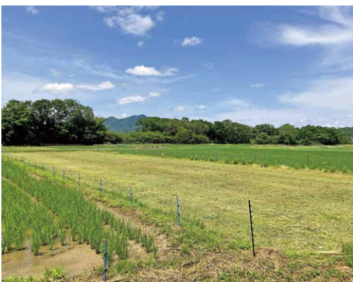
土師川高畑地区無堤防区域