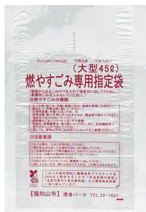
福知山市の指定ごみ袋

問 指定ごみ袋制度は平成13年2月から開始されており、その後の導入効果を踏まえ今後、家庭ごみの分別収集のあり方について市の考えは。 答 指定ごみ袋制度による家庭ごみ収集は市民に深く浸透し、作業時の安全確保やごみステーションの美観向上に寄与しており、廃棄物の資源化や安全に焼却や破碎をするための前提であり今後も継続する。