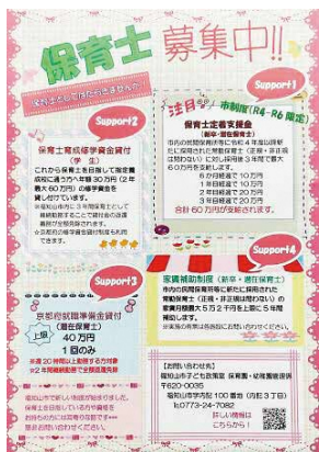
新たな制度で保育士募集をする福知山市

問 今年度の入所申し込みに対する保留児童・待機児童の現状は。 答 本市における令和5年4月時点での保留児童数は前年の令和4年4月時点の135人より約20人多い状況で、その内、待機児童が10人近く生じることになる。