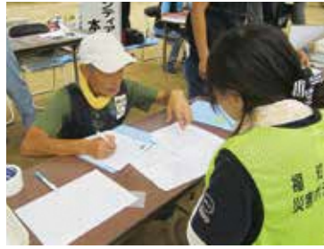
災害ボランティアセンターの運営