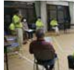
ちょっとした困りごとを支え合うしくみづくり