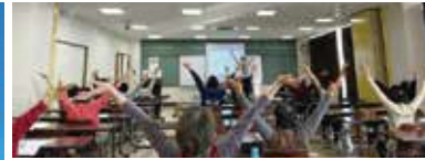
あんしん・みらい事業（契約による福祉サービスの提供、おいじたくカレッジの開催など）