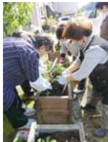
ボランティア活動の支援・普及