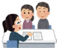
権利擁護体制の充実