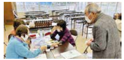
防災ネットワークづくり