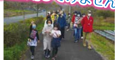
令和3年11月14日 福知山市社協 夜久野支所 夜久野ウォークラリー