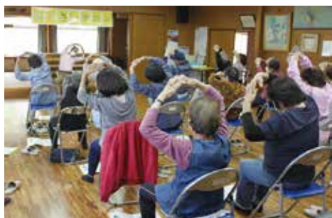
ふれあいいきいきサロンの支援