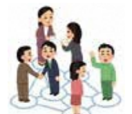
関係機関等と連携した総合相談支援体制づくり