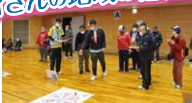
令和3年12月4日 福知山障害児(者)親の会 スポーツレクリエーション交流会