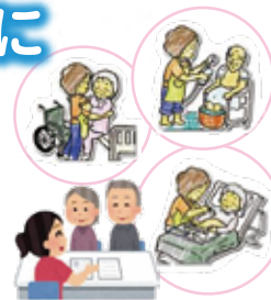
在宅福祉サービスの充実