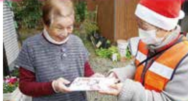
令和3年12月1日～25日 桃映地区民生児童委員協議会 ひとり暮らし高齢者見守り活動 “いい事ありますように”