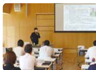
社会福祉施設・事業所のBCP（事業継続計画）策定講座