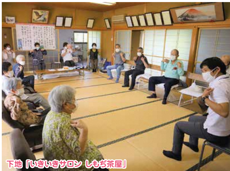
下地 「いきいきサロン しもぎ茶屋」