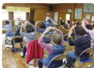
多保市あじさいサロン