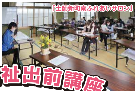
「土師新町南ふれあいサロン」