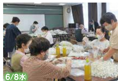
笑楽サロン(奥野部) 手作りの昼食で笑顔の輪が広がる きっと地域は大きな家族だ!