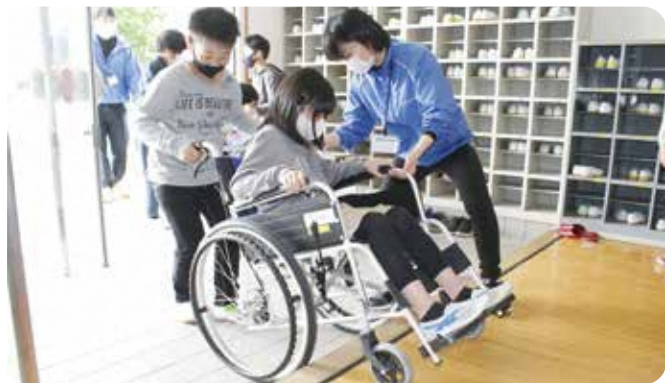
福祉教育の推進 市内小学校での車椅子体験

皆様からの会費は、住民同士のささえあいによる地域福祉活動推進のために、大切に使用させていただきました。ご協力いただき、誠にありがとうございました。