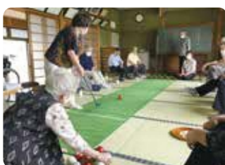
殿村いきいきサロン（私市）