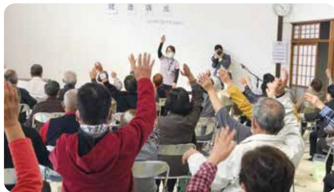
地域福祉活動推進の支援 上六人部地区福祉推進協議会福祉健康講座