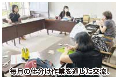
毎月の仕分け作業を通じた交流。

市内のボランティアグループ「ベルつながりの会」は、令和2年3月に設立され、現在、各地域公民館などに設置されている回収箱に集まったベルマークを回収し、第1金曜日に日新地域公民館で仕分け作業を通じた交流活動をされています。