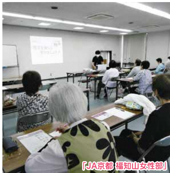
「JA京都 福知山女性部」