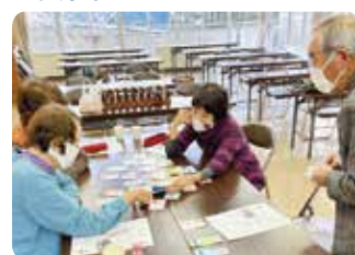
カードゲームで防災学習