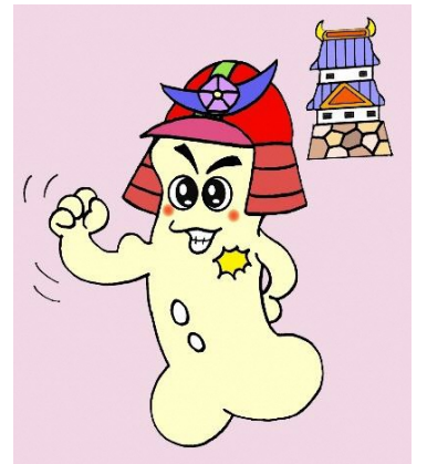
(名前) 福知 カル秀

せいちようき 成長期であるみなさんは、ほね は じょうぶ 骨や歯を丈夫にするカルシウム をたくさんとる必要があります。また、カルシウムは、いしき 意識 してとらないと ぶそく 不足しやすい栄養素でもあります。 そのため、給食センターでは、カルシウムの大切さを伝える ために平成30年度から福知山城を築いた明智光秀にちな んでキャラクターを考案し、カルシウムが多く含まれる日を 「カル秀メニュー」の日としました。