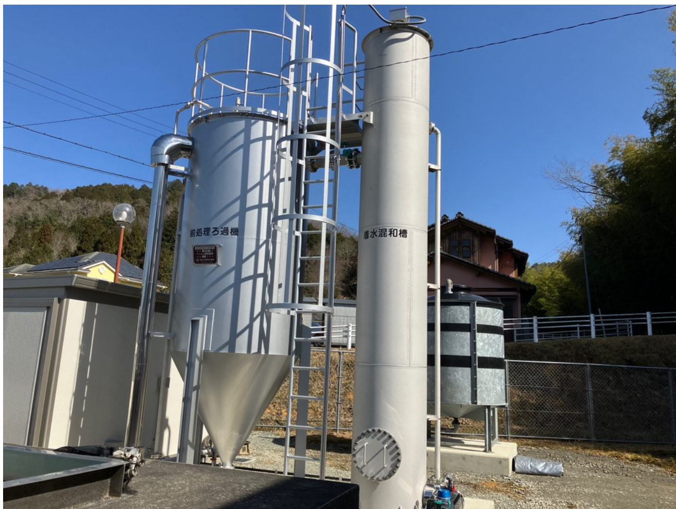
菟原浄水場 前処理設備