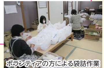
ボランティアの方による袋詰作業

食の応援パックお渡し会の準備や当日の運営では、ボランティアの皆さん、ふれあい福祉相談員の皆さんにもお世話になりました。