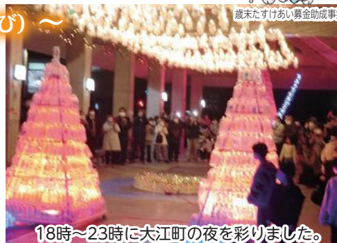
18時~23時に大江町の夜を彩りました。

今年は、昨年の鬼の角をモチーフにしたペットボトルタワーに加え、ランタンや、貸出可能なミニタワーなども作製し、鬼の回廊に設置しました。