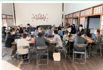
11/25(金) 上六人部地区福祉推進協議会 介護講座「在宅介護って?」を開催。 意見交換もされました。