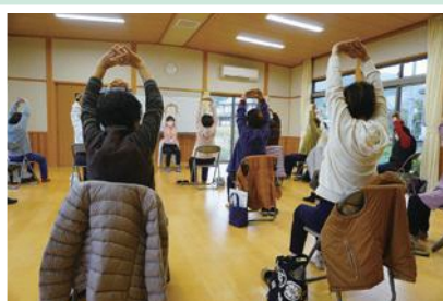
11/30(水) ひまわり健康サークル(上豊富) 無理なく楽しく「貯金体操」で 健康づくり♪