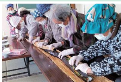
12/7(水) 天座にこここサロン 長巻き寿司づくり 息を合わせて“おいしくなあれ”