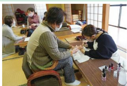
12/5(月) なないろ(高畑) 「ネイルとハンドマッサージの集い」 クリスマスや新年のネイルアートを満喫