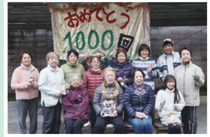
12/12(月) 上紺屋ラジオ体操部 地域の親睦・活性化につながる ラジオ体操 1000 回記念