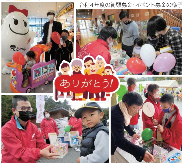
令和4年度の街頭募金・イベント募金の様子