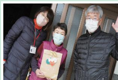
12/4(日) 下六人部地区福祉推進協議会 おひとり暮らし高齢者の安心・安全見守り事業 心温まるクリスマスプレゼントをお届け!