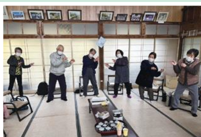
11/17(木) ささき会(上佐々木) サロンの最後は、恒例の 「はとぼっぼ体操」♪