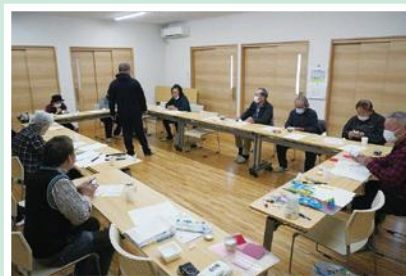
10/30(日) 東堀ふれあいきいきサロン 毎年恒例の干支のおきものづくり。 紙粘土で個性豊かな「うさぎ」が完成!