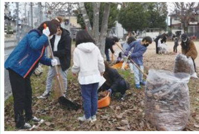
12/11(日) 昭和新町 昭寿会、子ども会、 なないろえん、健友会 多世代が協力し合って公園の落ち葉掃除