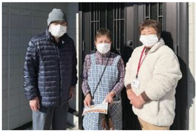
12/18(日) 佐賀地区福祉推進協議会 年末の“ふれあい給食”! みんなでよいお年を!