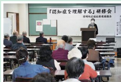
11/19(土) 惇明地区福祉推進協議会 認知症を理解する研修会 (講師:社協三和支所グループデイ管理者)