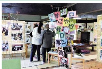
10/19・22・23・26 すこやかサロン(友淵) 活動5年目の節目に古民家Cafeで 300枚の写真を展示