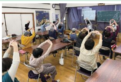
10/20(木) 西佳屋野ふれあいサロン 日新地域包括支援センター職員による 健康体操。楽しく健康づくりを!