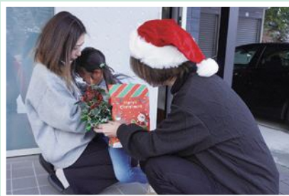
12/24(土) 金谷地区福祉推進協議会 子育て世帯へ「クリスマス訪問」 手作りツリーとお菓子のプレゼント