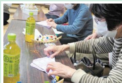
11/28(月) 新庄いきいきサロン ハンカチで世界に一つだけの 「干支うさぎづくり」