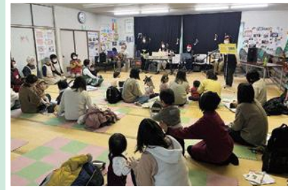
12/21(水) 成仁赤ちゃんサロン クリスマスソングで、楽しいひと時を♪