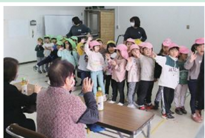
11/28(月) 中六人部地区福祉推進協議会 中六人部保育園の園児が歌や将来の夢の 発表を通じておひとり暮らし高齢者と交流