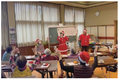
12/11(日) 観音寺自治会「スマイルサークル」 サンタがみんなに 笑顔を届けてくれました♪