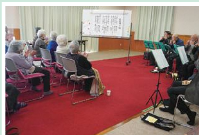
12/8(木) 野花ふれあいサロンむつみ会 ハーモニカに合わせ 懐かしい曲を皆さんで歌唱