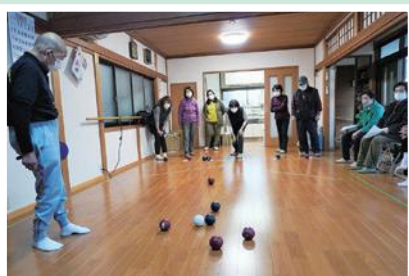
11/23(水) 昭和東地区いきいきサロン 和久市町対象企画 転がしたり投げたり 工夫を重ねてポッチャ体験