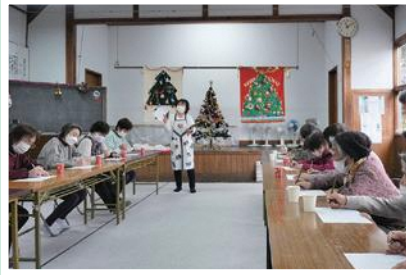
12/21(水) 猪崎ふれあいいきいきサロン スカットボールとボウリングに 野菜ビンゴを楽しむクリスマス会