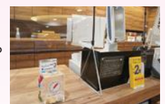
TSUTAYA AVIX福知山店の 設置の様子