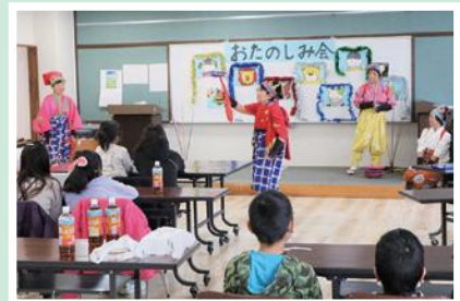
12/24(土) 福知山市母子寡婦福祉会 「お楽しみ会」親子で工作＆「南京玉 すだれ八房流福天会」の皆さんと交流